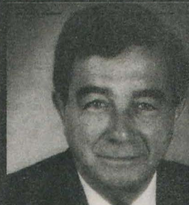
ZACH DE BEER

2 Stembriewe 2 Demokrate - 2 Parlemente BEVRY DIE KAAP 27 & 28 APRIL