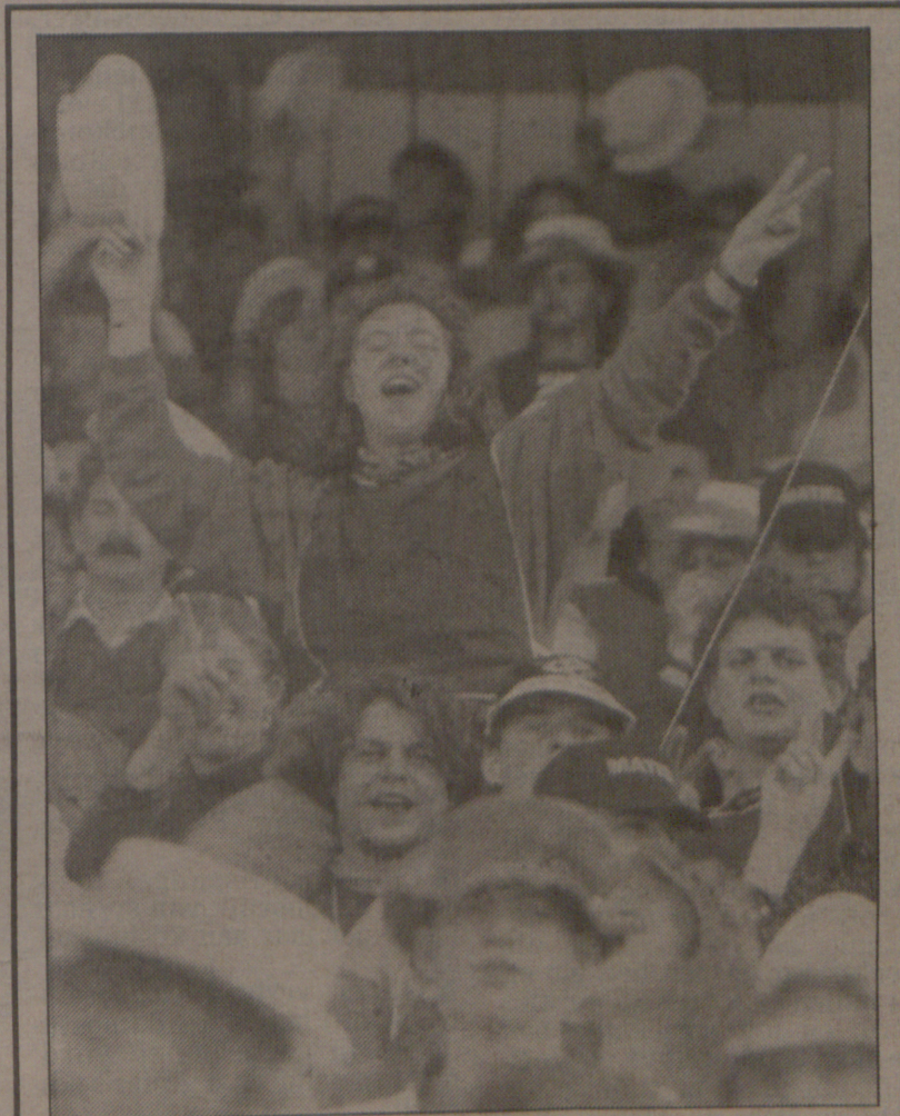
Intersity: die dag waarop die Matiespan hul Streeptril teenstanders met 34-6 verneder het. En natuurlik was almal in 'n besonder goeie gees.

Met die ter perse gaan van die voorblad van Die Matie was daar nog geen duidelikheid of die inligting wat in Die Matie vervat is wel op kampus mag verskyn nie. Die geregtelike kwessies wat die verkiesing se geldigheid, al dan nie, kan bepaal moet eers opgelos word, voordat die publikasie in enige vorm 'n sekerheid is.