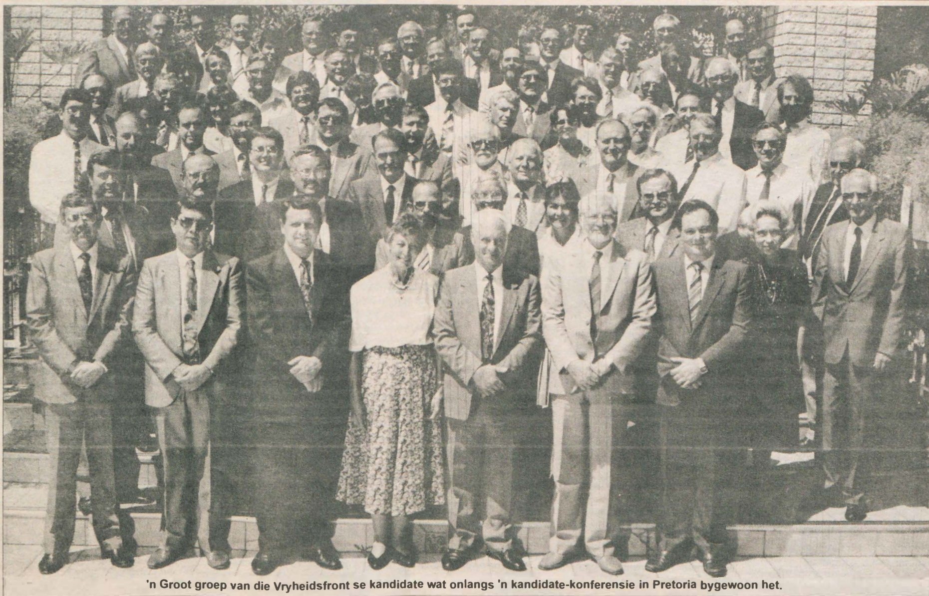
'n Groot groep van die Vryheidsfront se kandidate wat onlangs 'n kandidate-konferensie in Pretoria bygewoon het.