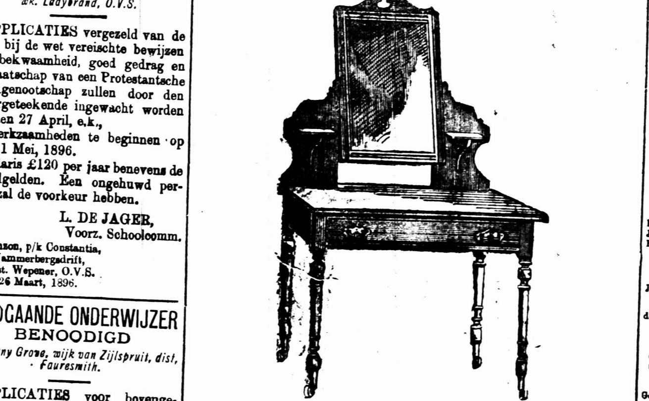
VOET KLEEDTAFEL voorzien van een Spiegelglas 18 duim bij 14 duim op patente vlietjes. £3 7s.

Bovengenoemde is aanmerkelijk beneden in prijs dan de inferieure ingevoerde artikelen en daar wij slechts heit gebruiken die goed gedroogd is in de Kolonie sullen Koopers het voordeel hebben van ons waarborg dat de artikelen de hitte van het klimaat zullen staan.