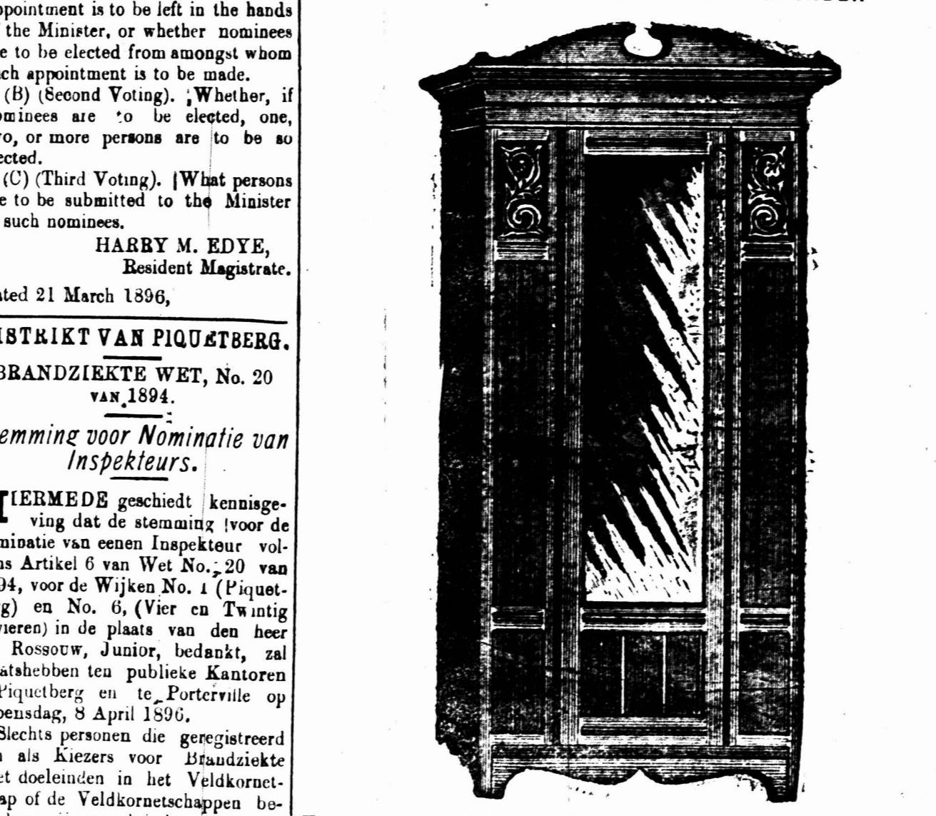
HANGKAST, 3 Voet 4 Duim wijd en 6 Voet 9 Duim hoog, met Spiegelglas 48 Duim bij 14 Duim. £5 5s.