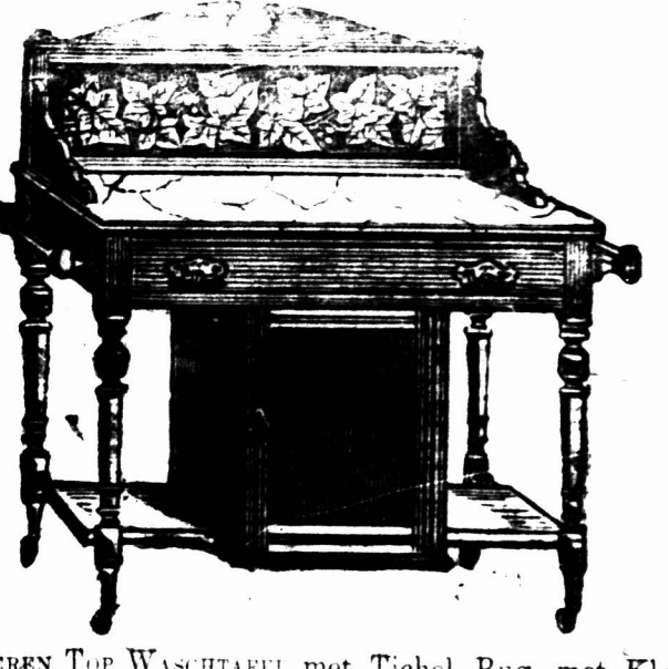
3 VOET MARMEREN TOP WASHAFEL met Tichel Rug, met Klein Kastje beneden, en een Kapstok aan elke Zijde. £2 14s.