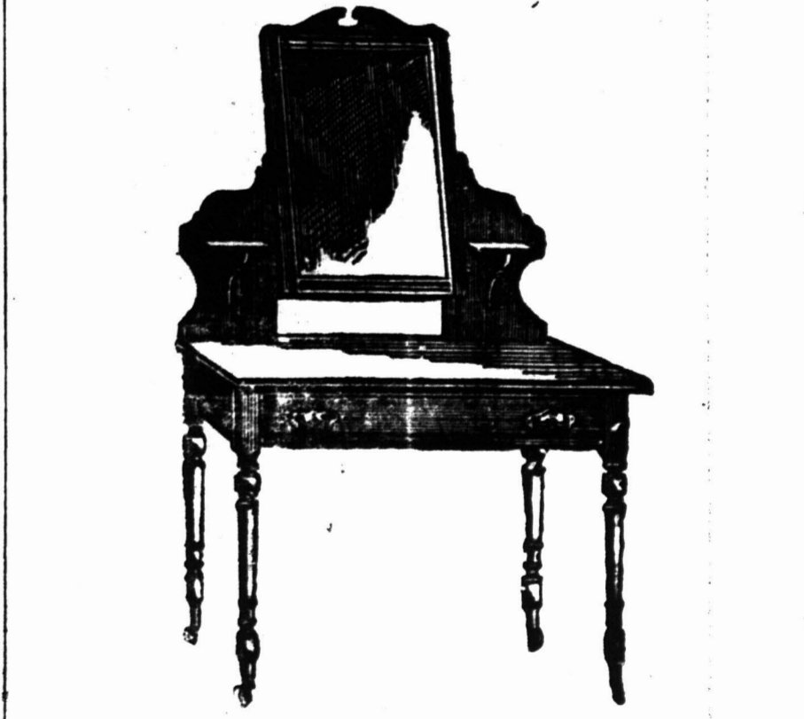
1 Voet 11 Duim hoog, met Kleefplaat voorzien van Spiegelglas 18 duim bij 14 duim op patente vleitjes. 22 7s.