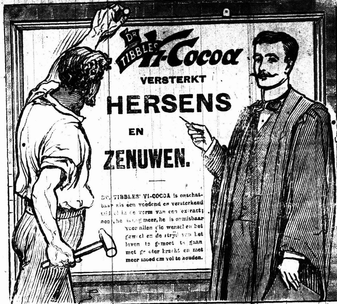
Is te koop bij alle winkeliers en apothekers of aan het Londen adres: 80, 81 & 82, Bunhill Row, E.C.

DE ondergeteekende, te teekenen en zoe vele andere naamtekeningen al mogelijk er op te krijgen en de petitie dan zoo spoedig mogelijk per post in een enveloppe te zenden naar Bus 676, Kaapstad. Copieën van deze petitie zouden kunnen verkregen worden op aanvraag aan ONS LAND Kantoor.