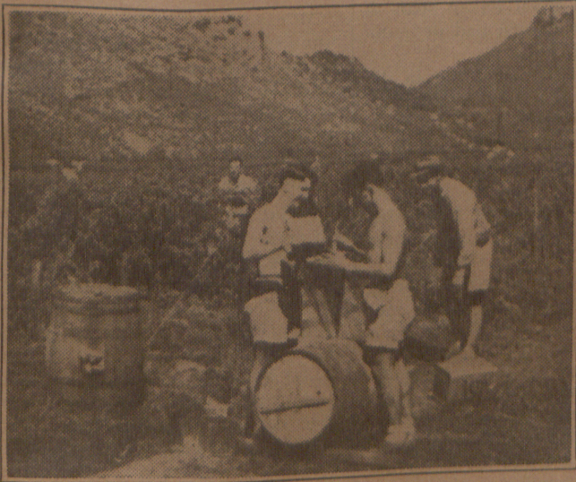
Bessies word in vate gegooi.