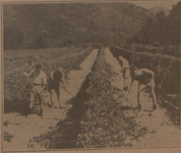
Kampele besig met skoffelwerk.

Met hierdie omvattende organisasie word daar besonder goeie beheer uitgeoefen oor alles wat in die kamp gebeur, en loop die hele kampelewe ook netjies en ordelik af.