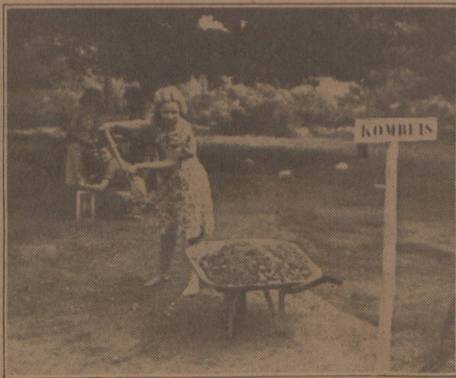
'n Dame besig om die kamp- kombuis skoon te maak.

Tot drie-uur is dit rustyd in die kamp. Daarna word met die gewone prosedure 'n begin gemaak met die middag-skof, wat tot ses-uur duur. Nou skei almal uit om te gaan swem