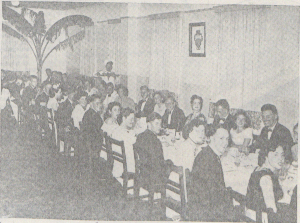
HUISDINEE VAN HELDERBERG

Dat hier met 'n baie belangrike saak 'n aanvang gemaak is, is ongetwyfeld waar. Ons wil die vertroue uitspreek dat die buro so spoedig moontlik al reelings sal kan tref vir die komende Desember-Maart-vakansie.