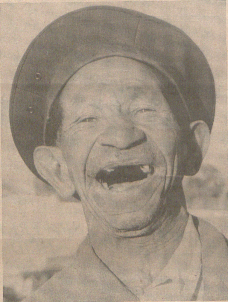
„Auk, my kleinbaas en kleinnôï, stem vir my!"

„Seker vir die eerste keer in die geskiedenis van studentebetrekkinge in Suid-Afrika vir die afgelope dekade het daar nou 'n organisasie tot stand gekom waarmee die Studenteraad van die Afrikaanse universiteite sal wil saamwerk. En dit is dan ook die alternatief wat ons bied vir die gedagte van 'n Suid-Afrikaanse Studentebond — en hierdie is inderdaad geen nuwe gedagte nie. Reeds in 1959, 1961 en ook verlede jaar het sodanige pogings op die pad van mislukking gegaan omdat die kloof tussen Afrikaans- en Engelssprekende so groot was dat dit net nie in een grondwet oorbrug kan word nie. Kompromië is vir albei groepe onaanvaarbaar."