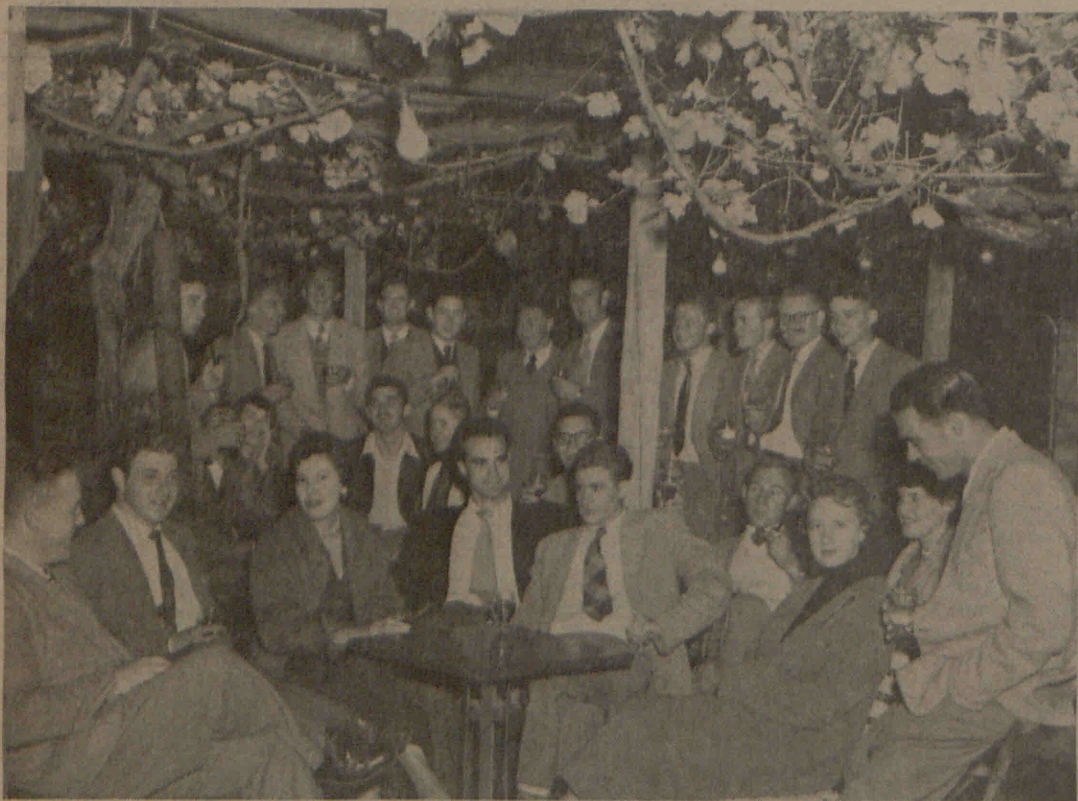
Die Intervarsity-komitees van die Maties en Ikeys verkeer gesellig in die biertuin van 'n plaaslike hotel.