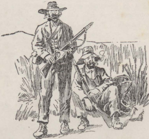
Boeren op wacht.

Zoo dachten en zoo spraken zij. Maar hun vreugde was van korten duur. Op zekeren dag bij het aanbreken van den morgen, werden zij gewekt door den vreeselijken kreet: »Moordenaars, moordenaars.» Wat