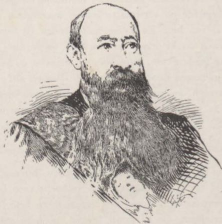
STEIJN, President van den Oranje-Vrijstaat.

En nu, Majesteit, deelde men den Boeren plotseling mede, »Uwe slaven zijn vrij. Dat en dat bedrag, dat je in Engeland kunt gaan halen, zal U voor dit verlies schadeloos stellen». Kon men nu van den Boer verwachten, Majesteit, dat hij met zijn ossenwagen of te paard daarheen ging en zijn geld haalde? In dien tijd zulk eene lange en gevaarlijke reis te ondernemen (die minstens 100 dagen zou hebben geduurd) zou natuurlijk meer hebben gekost, dan de geringe som bedroeg, die als schadeloosstelling werd uitgekeerd. Er bleef dus voor den Boer niets anders over, dan óf den Engelschen handelaar, van wien hij de slaven voor