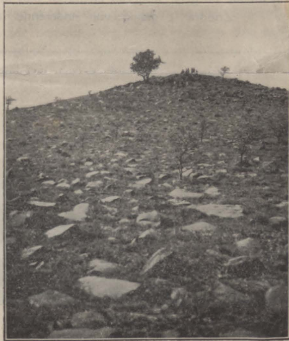
Kopje, waarop het monument zal worden geplaatst

Een van de manschappen schoot tot tweemaal toe een infanterist neer, die doende was