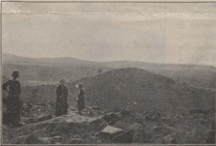
Hetzelfde Kopje, van uit de verte gezien.

Zoodra 't geluid van naderende lansiers of dragonders vernomen werd, stonden de