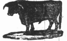
30 VETTE SLAGTOSSEN.