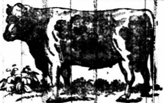
50 Extra Vette Slagtossen.

De Zuid-Afrikaan en Volksvriend... Op Dinsdag, 22sten dezer, ZAL de Ondergeteekende publiek doen verkopen te KLAPMUTS STATION, bovengemeld getal Ossen.