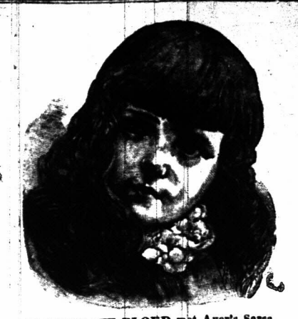
ZUIVER TW BLOED met Ayer's Sarsaparilla.