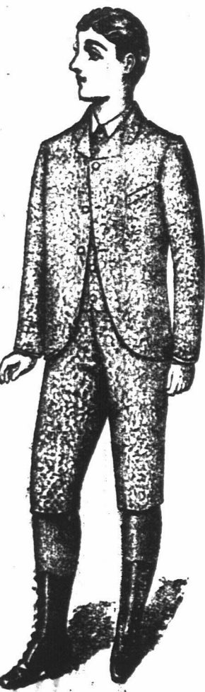
JONGENS RUGBY PAKJES

In effen en fancy Tweeds, zwart en blaauw Corkscrew en Venetiaansch van af 8/6. Past Jongens van 5 tot 10 jaar oud. Te verkrijgen alleen bij de "Economic Outfitting" Maatschappij, Hoek van Spin- en Pleinstraat, Kaapstad.