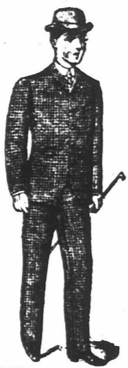
JONGENS CONNAUGHT PAKJES

In Harris, Bannockburn, Oberviot, Homepun en 8. hotsche Tweeds, Vicuna, Serge Zwart en Blaauw Diagonaal en Corkscrew. Prijzen van af 8/6. voor Jongens van 4 tot 11 jaar oud. Alleen te verkrijgen bij de "Economic Outfitting" Maatschappij, Hoek van Spin- en Pleinstraat, Kaapstad.