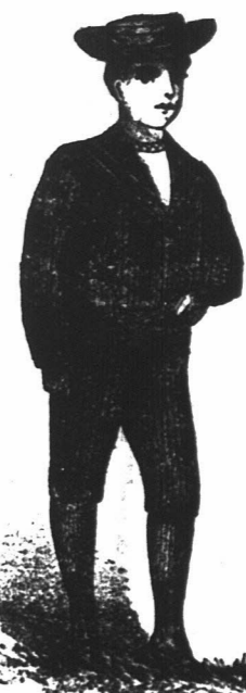
JONGENS MATROZEN PAKJES.

Wij zijn bereid het Publiek, als het ons bezoekt, te overtuigen dat de geheele bovenstaande advertentie correct is, en aan hen, die ons niet persoonlijk kunnen bezoeken, zullen we met genoegen ons Geillustreerd Prijslijst Boek franco sturen, na schriftelijk aanzoek aan de