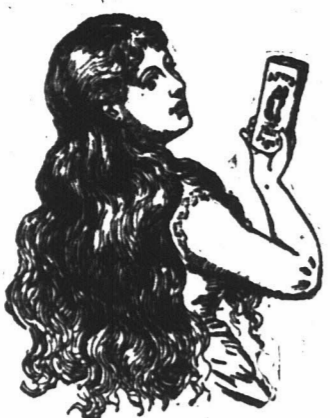
De populariteit van Ayer's Haar-Versterker...