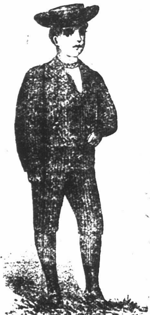
BLAAUWE EN GRIJZE MA. "ROZEN PAKKEN" ook in fancy Tweeds, van 4/6 tot 2s/ voor Jongens van 4 tot 10 jaar oud. Te verkrijgen alleen van de "Economic Outfitting" Maatschappij, Hoek van Spin- en Pleinstraat, Kaapstad.

LET WEL!—Speciaal Koopje van 175 dozijn Man's geheel Wollen Onderhemden en do. Broeken, zelfde vorm en makeel als JAKSEN'S 4s. 6d.; gewone prijs 12s. 9d.