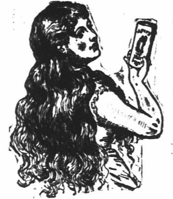
De populariteit van Ayer's Haar-Versterker...