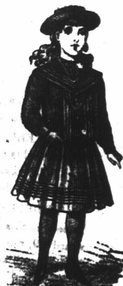
MEISJES OOSTUMES. Wij hebben een groeten voorraad in Witte Fancy Drille, blaauw, wit en gekleurde Serge. Prijzen van af 2/11. Past Meisjes van 4 tot 10 jaar oud. Te verkrijgen bij de "Economic Outfitting" Maatschappij, Hoek van Spin en Pleinstraat, Kaapstad.