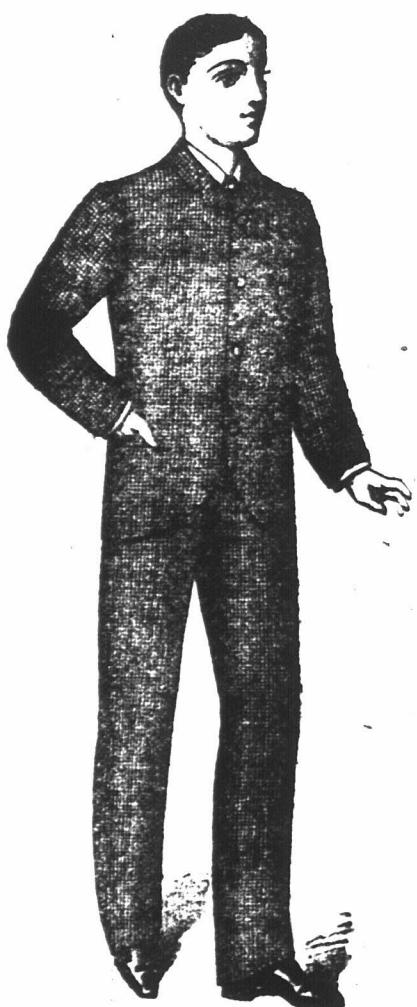
ANGLESEA PAKKEN In effen en fancy Tweeds, verschillende kleuren van 16/6 af, voor Jongens van 10 tot 16 jaar oud. Te verkrijgen alleen bij de "Economic Outfitting" Maatschappij, Hoek van Spin- en Pleinstraat, Kaapstad.

HOEK VAN SPIN- EN PLEINSTRAAT, KAAPSTAD.