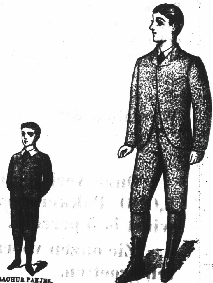
JONGENS RUGBY PAKJES In Athol, Bannockburn of Schotisch Tweed, van af 12/6; zij passen Jongens van 4 tot 11 jaar oud. Te verkrijgen alleen bij de "Economic Outfitting" Maatschappij, Hoek van Spin en Pleinstraat, Kaapstad.