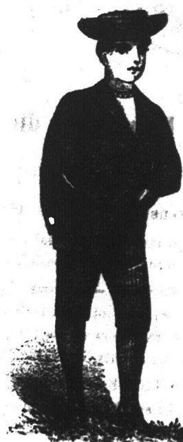
JONGENS MATROZEN PAKJES. Wij hebben een groote verscheidenheid in deze soort, kleur, Vaal, Grijs en Blaauw Serge en Homespun. Tweeds in verschillende kleuren. Wit of zwaarte Drijs en Galotte, Witte en gekleurde Flanel. Bovenstaande te verkrijgen van 2/6, 3/6, 4/11, 5/6, 6/6, 7/6, 8/11 tot 20/100, bij de "Economic Outfitting" Maatschappij, Hoek van Spin- en Pleinstraat, Kaapstad.

Wij zijn bereid het Publiek, als het ons bezoekt, te overtuigen dat de geheele bovenstaande advertentie correct is, en aan hen, die ons niet persoonlijk kunnen bezoeken, zullen we met genoeg ons Geillustreerd Prijslijst Boek franco sturen, na schriftelijk aanzoek aan de