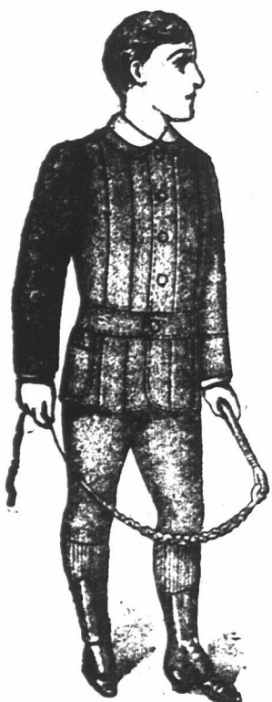
JONGENS NORFOLD PAK Bannockburn, Harris en Schotisch Tweeds, Vienna, Serge Zwart en Blaauw Diagonaal en Corksorb. Prijzen van af 8/6, voor Jongens van 4 tot 11 jaar oud. Alleen te verkrijgen bij de "Economic Outfitting" Maatschappij, Hoek van Spin- en Pleinstraat, Kaapstad.