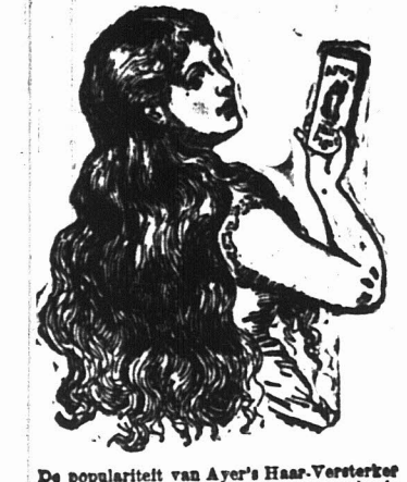
De populariteit van Ayer's Haar-Versterker is het overtuigend bewijs van zijn waarde als...