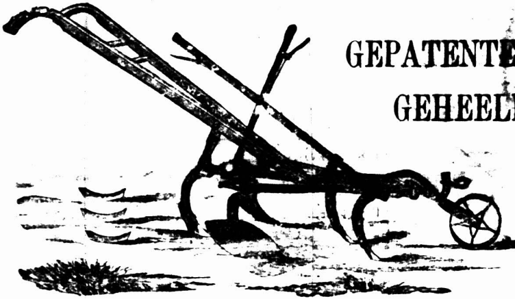
Dezelfde Machine als Cultivator voor Mielies, Tabak, Aardbezien en voor het uitgrazen van Aardappelen, enz.