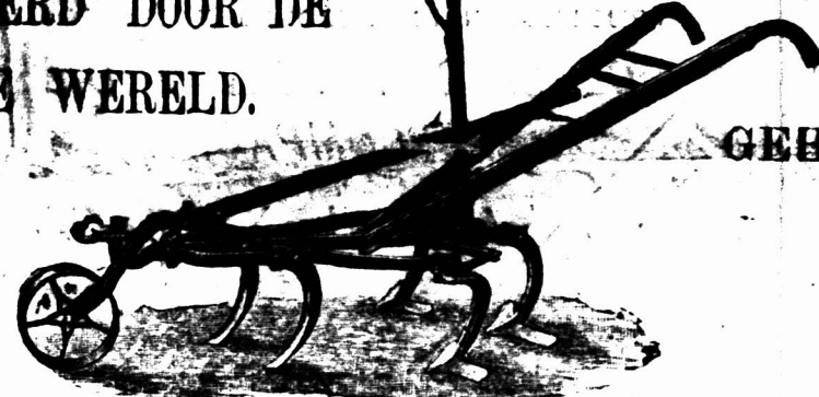
Dezelfde Machine voorzien van platte stalen Scharen voor het schoffelen van Wijngaarden.