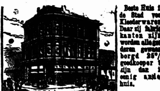
Beste Huis in de Stad voor Kleermakers...

VOOR GOEDE WAARDE IN JONGENS KLEEDEREN, GA NAAR DE Economic Outfitting Co.