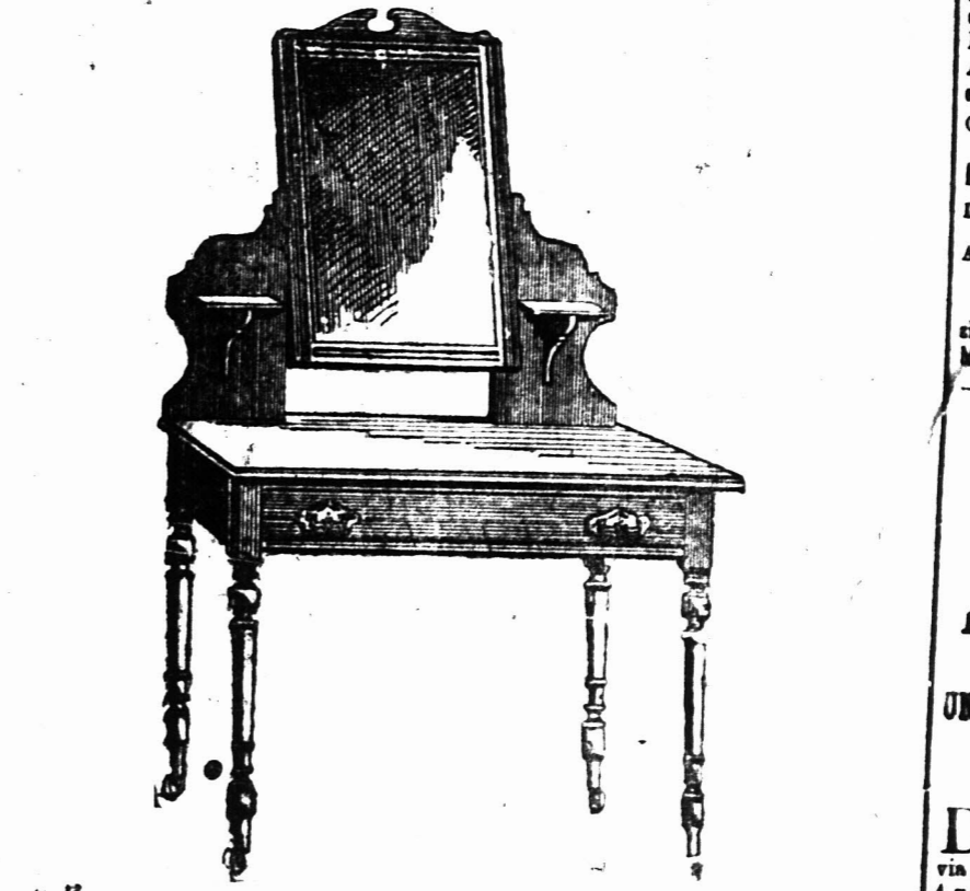
3 voet KLEEDTAFEL voorzien van een Spiegelglas 18 duim bij 14 duim op patente wietjes. £2 7s.

D. ISAACS & CO. STOOM KABINET FABRIEK, BARRACK-STRAAT EN BOOM-STRAAT, UITSTAL KAMER, LANGMARKT-STRAAT EN PLEIN STRAAT, KAAPSTAD