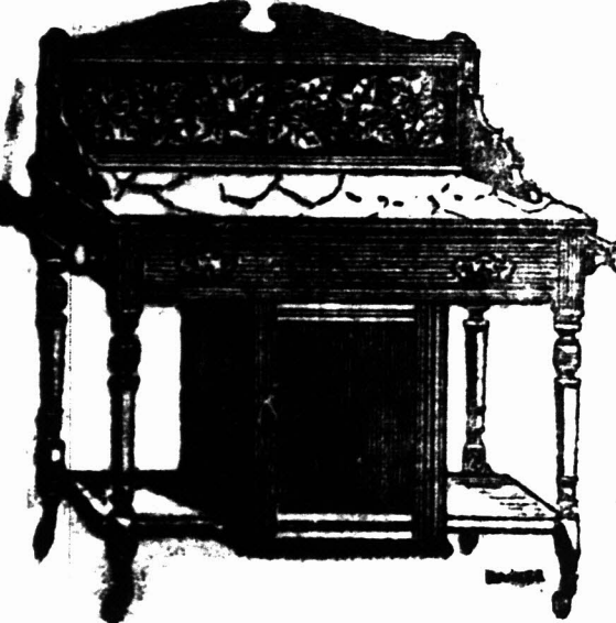
3 voet MARMEREN-TOP WASHTAFEL met tichel rug, met klein kastje beneden, en een Kapotok aan elke zijde. £3 14s.