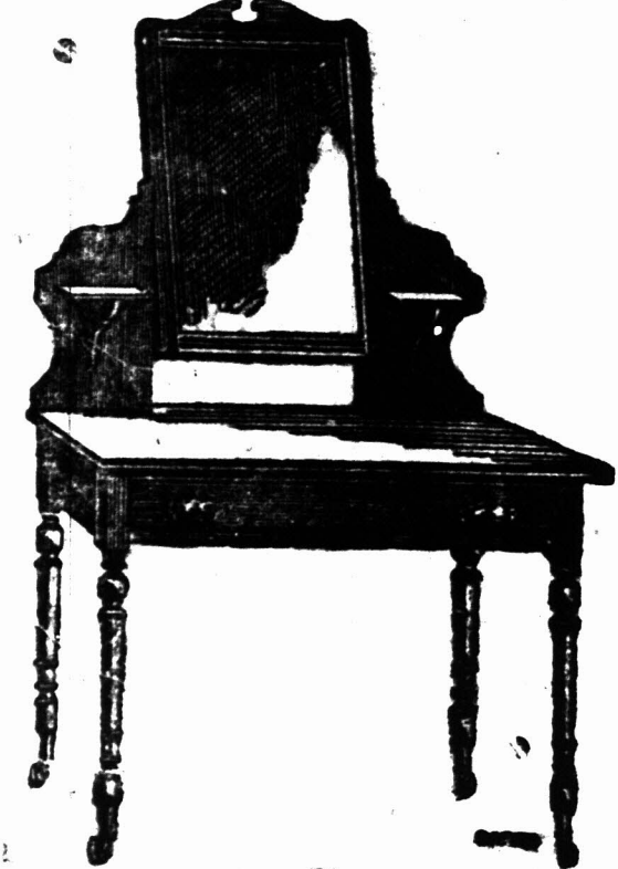
3 voet KLEEDTAFEL voorzien van een Spiegelglas 18 duim bij 14 duim op patente wicetjes. £2 7s.

D. ISAACS & CO., STOOM KABINET FABRIEK. UITSTAL KAMERS. BARRACK-STRAAT LANGMARKT-STRAAT BOVENS-TRAAT, PLEIN-STRAAT. KAAPSTAD.