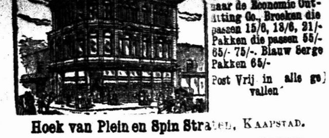
Hoek van Plein en Spin Straat, KAAPSTAD.