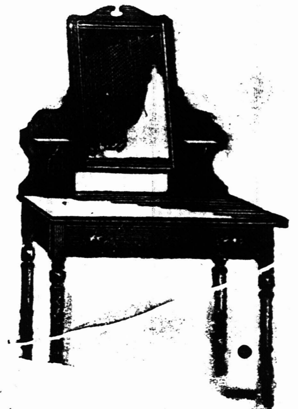
3 voet KLEEDTAFEL voorzien van een Spiegelglas 18 duim bij 14 duim op patente wietjes. £2 7s.