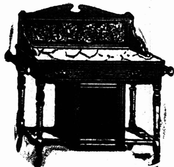
3 voet MARMERE-TOP WASHTAFEL met tichel rug, met klein kastje beneden, en een Kapstok aan elke zijde. £2 14s.