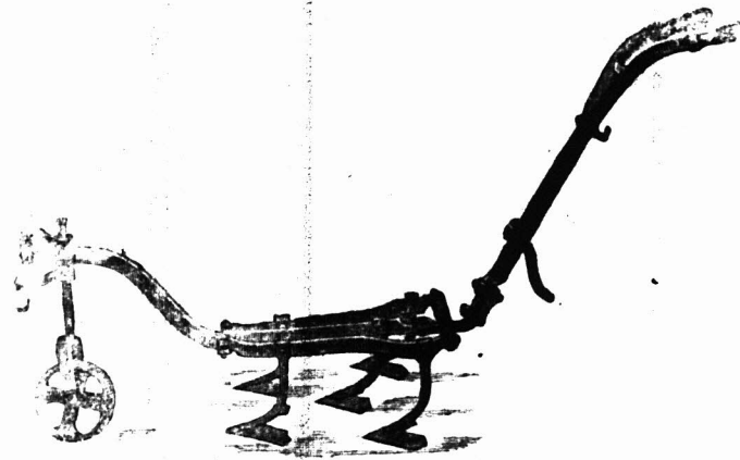
De "Iron Age" Hark en Cultivator Vereenigd. De R. M. R. Speciale Stalen Wingerd Graven.

R. M. ROSS & Co., STRANDSTRAT, KAAPSTAD.