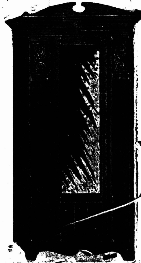
HANGKAST, 3 voet 4 duim wijd en 6 voet 9 duim hoog, met Spiegelglas 48 duim bij 14 duim. £5 5s.