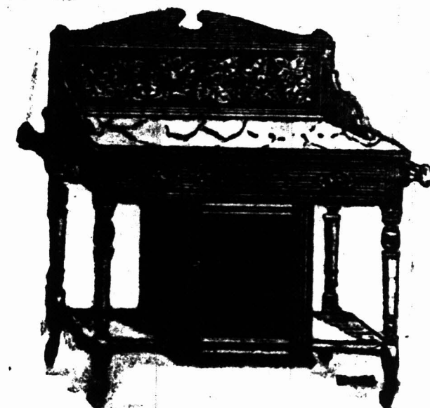
3 voet MARMEREN-TOP WASHTAFEL met tichel rug, met klein kastje beneden, en een Kapstok aan elke zijde. £3 14s.