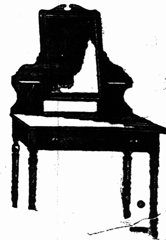
3 voet KLEEDTAFEL voorzien van een Spiegelglas 18 duim bij 14 duim op patente wielletjes. £2 7s.

Bovengenoemde is aanmerkelijk beneden in prijs dan de inferieure ingevoerde artikelen en daar wij slechts hout gebruiken die goed gedroogd is in de Kolonie sullen Koopers het voordeel hebben van ons waarborg dat de artikelen de hitte van het klimaat sullen staan.