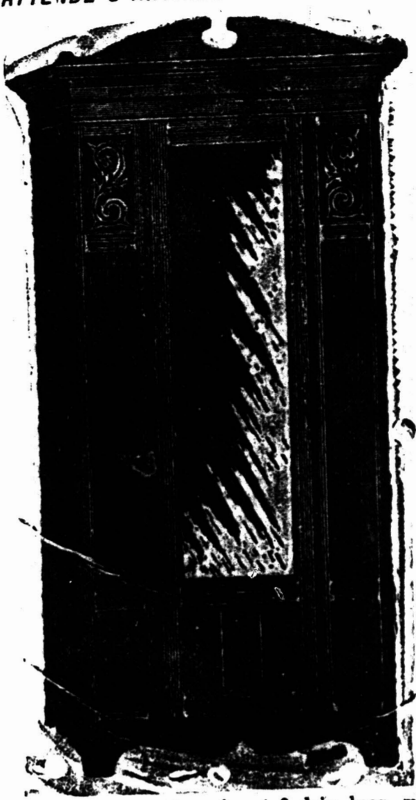
HANGKAST, 3 voet 4 duim breed en 6 voet 9 duim hoog, met Spiegels en 48 duim bij 14 duim. £5 5s.

£9 16s. £9 16s. BEVATTENDE 3 ARTIKELN ALS HIERONDER: