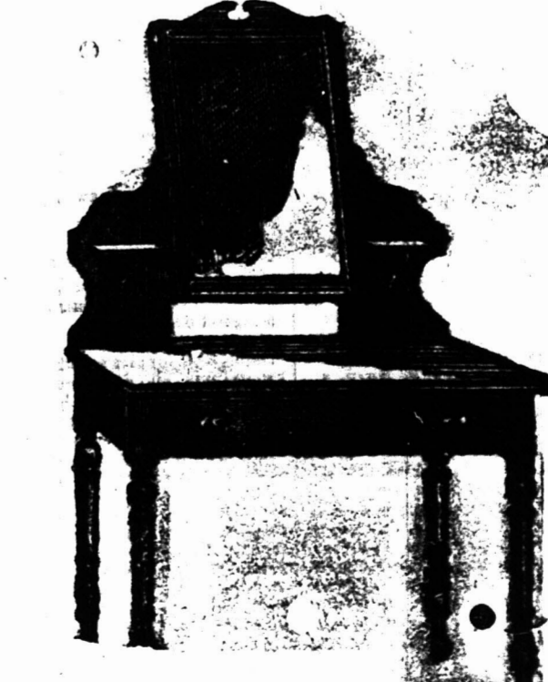
3 voet KLEEDTAFEL voorzien van een Spiegels 18 duim bij 14 duim op patente vicietjes. £2 7s.

Bovengenoemde is aanmerkelijk beneden in prijs dan de inferieure ingevoerde artikelen en daar wij slechts hout gebruiken die goed gedroogd is in de Kolonie sullen Koopers het voordeel hebben van ons waarborg dat de artikelen de hitte van het klimaat sullen staan.