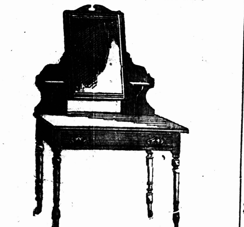
3 voet KLEINER voorzien van een Spiegeglas 18 duim bij 14 duim op patente wielletjes. £3 7s.

D. ISAACS & CO. STOOM KABINET FABRIEK. BARRACK-STRAAT. UITSTAL KAMERS. LANGMARKT-STRAAT. BOOM-STRAAT. LEIN STRAAT. KAAPSTAD.