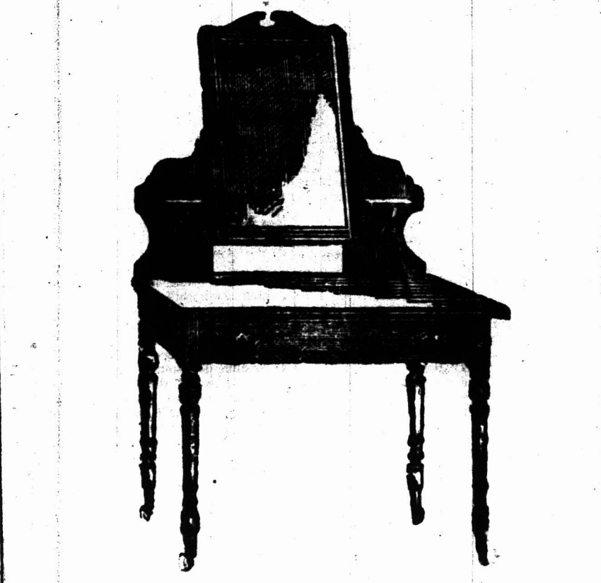
3 Voet KLEIN TAFEL voorzien van een Spiegelglas 18 duim bij 14 duim op patente wieseltjes. 22 7s.

Bovengenoemde is sannekerkelijk bekend te prijzen dan de inferieure ingeoorde artikelen en daar wij slechts hout gebruiken dat goed gedroogd is in de Kolonie sullen Koopers het voordeel hebben van onze waarborgd te de artikelen de hitte van het klimaat sullen staan.