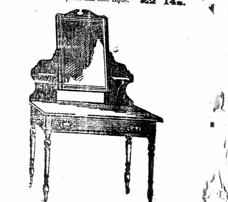
3 VOET KLEEDTAFEL voorzien van een Spiegelglas 18 duim bij 14 duim op patente wietjes. £2 7s.

Bovengenoemde is aanmerkelijk beneden in prijs dan de inferieure ingevoerde artikelen en daar wij slechts hout gebruiken dat goed gedroogd is in de Kolonie zullen Koopers het voordeel hebben van onze waarborgd at de artikelen de hitte van het klimaat zullen staan.