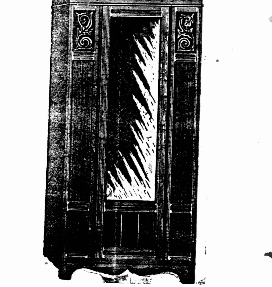
HANGKAST, 3 voet 4 Duim wijd en 6 Voet 9 Duim hoog, met Spiegelglas 48 Duim bij 14 Duim. £5 5s.