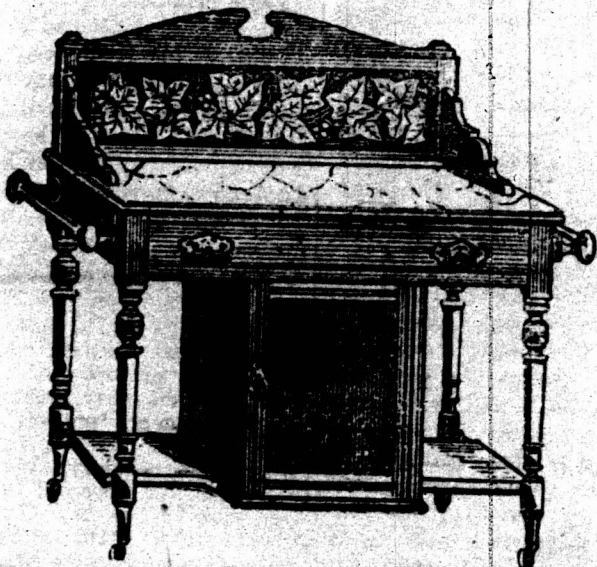
3 VOET MARBLEN TOP WASOFTAFEL met Tichel Rug, met Klein Kastje beneden, en een Kapotok aan elke Zijde. 22 14s.