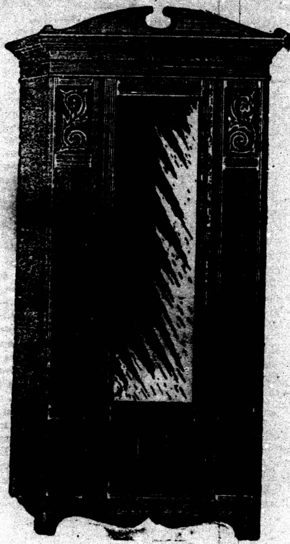
HANGKAST, 3 voet 4 Duim wijd en 6 Voet 9 Duim hoog, met Spiegelglas 48 Duim bij 14 Duim. 45 5s.

(ONS EIGEN MAAKSEL), IN GOED GEDROOGD SOLIED ESSCHENHOUT, KOMPLEET, 29 16s. 29 16s.