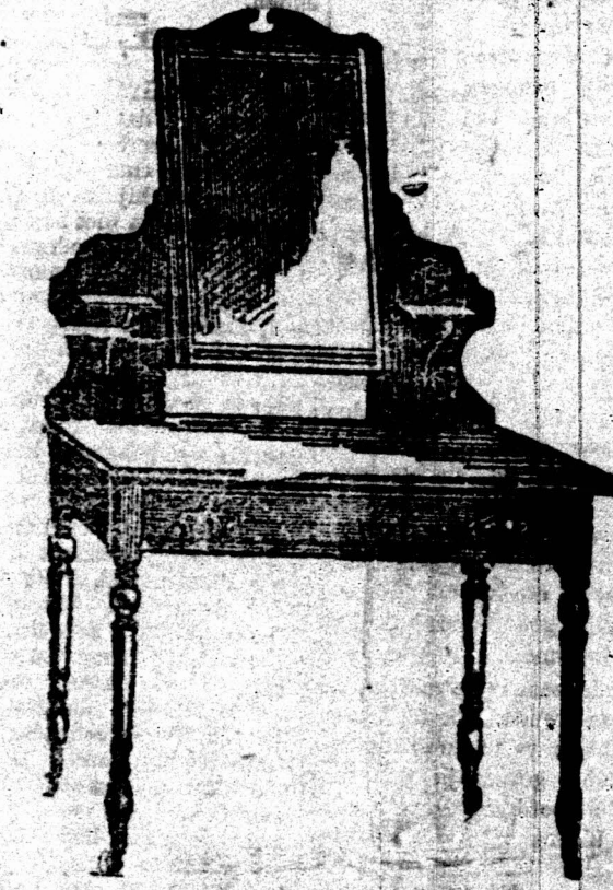
3 VOET KLIEDTAFEL voorzien van een Spiegelglas 18 duim bij 14 duim op patente wielotjes. 22 7s.

Bovengenoemde is aanmerkelijk beneden in prijs dan de inferieure ingevoerde artikelen en daar wij slechts hout gebruiken dat goed gedroogd is in de Kolonie sullen Koopers het voordeel hebben van onze waarborgd at de artikelen de hitte van het klimaat sullen steen.