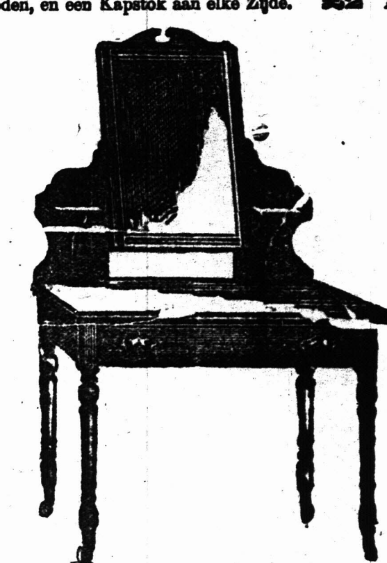
1 VOET KLEEDTAFEL voorzien van een Spiegelglas 18 duim bij 14 duim op patente wietletjes. £2 7s.

Bovengenoemde is aanmerkelijk beneden in prijs dan de inferieure ingevoerde artikelen en daar wij slechts hout gebruiken dat goed gedroogd is in de Kolonie sullen Koopers het voordeel hebben van onze waarborgd at de artikelen de hitte van het klimaat zullen staan.