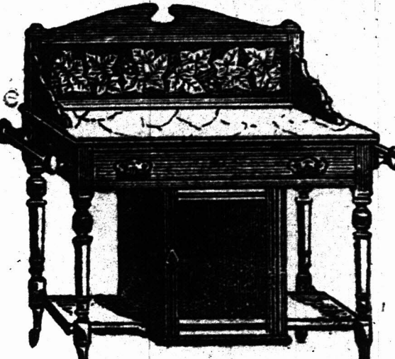
3 VOET MARBLEN TOP WASTAFEL met Tichel, 6ug, met Klein Kastje beneden, en een Kapstok aan elke Zijde. £2 14s.