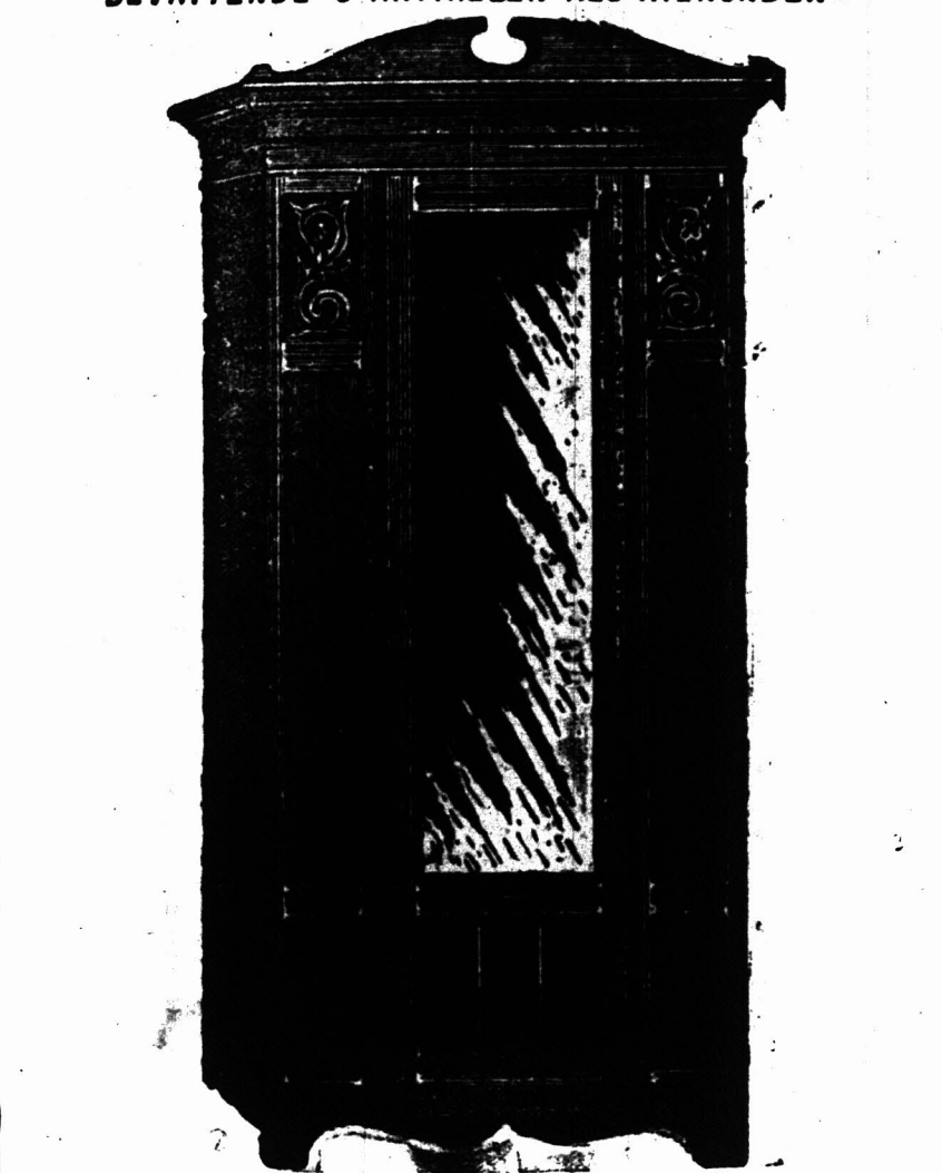
HANGKAST, 3 voet 4 Duim wijd en 6 Voet 9 Duim hoog, met Spiegelglas 48 Duim bij 14 Duim. £5 5s.