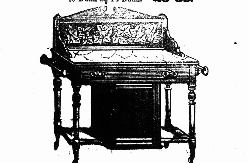
3 VOET MARMEEREN TOP WASCHTAFEL met Tichel Rug, met Klein Kastje beneden, en een Kapotok aan elke Zijde. £2 14s.