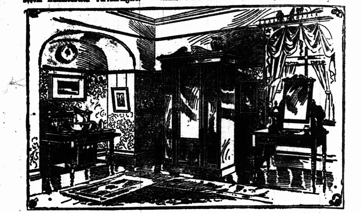
Solide Koloniaal-remakte Esschenhouten Slaapkamer Set. (Als hierboven geïllustreerd),