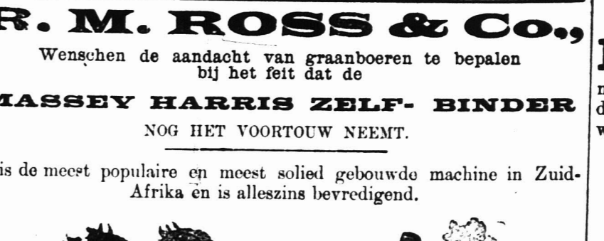
Schrift om prijzen en bijzonderheden.—Beste Manila Bind-gaarntakten 5d. per lb.

R. M. ROSS & Co., Wenschen de aandacht van graanboeren te bepalen bij het feit dat de MASSEY HARRIS ZELF- BINDER NOG HET VOORTOUW NEEMT. 'e is de meest populaire en meest solied gebouwde machine in Zuid-Afrika en is alleszins bevredigend.