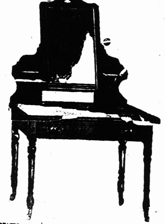
VOET KLEEDTAFEL voorzien van een Spiegelglas 18 duim bij 14 duim op patente wietjes. £2 7s.

Bovengenoemde is aanmerkelijk beneden in prijs dan de inferieure ingevoerde artikelen en daar wij slechts hout gebruiken dat goed gedroogd is in de Kolonie zullen Koopers het voordeel hebben van onze waarborgd dat de artikelen de hitte van het klimaat zullen staan.