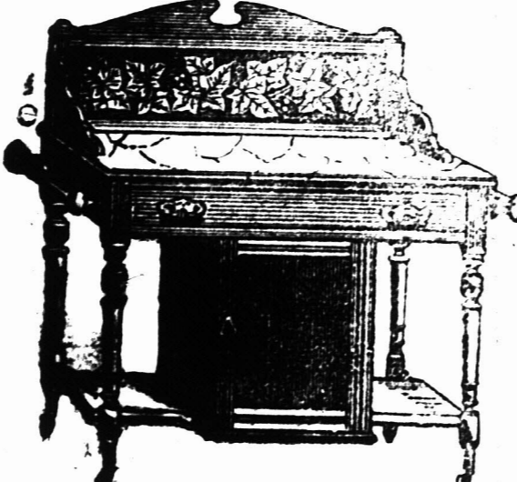
VOET MARBLEN TOP WASCHTAFEL met Tichel Rug, met Klein Kastje beneden, en een Kapstok aan elke Zijde. £2 14s.