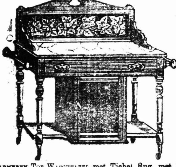
5 VOET MARMELEN TOP WASTAFEL met Tichel Rug, met Klein Kastje beneden, en een Kapstok aan elke Zijde. $2 14s.