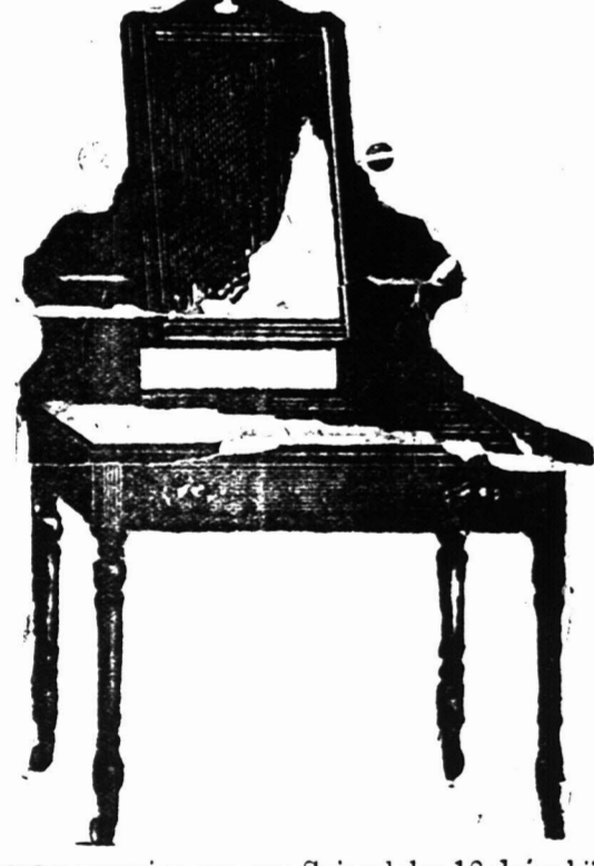
1 VOET KLEEDTAFEL voorzien van een Spiegelglas 18 duim bij 14 duim op patente wieteljes. $2 7s.

Bovengenoemde is aanmerkelijk beneden in prijs dan de inferieure ingevoerde artikelen en daar wij slechts hout gebruiken dat goed gedroogd is in de Kolonie zullen Koopers het voordeel hebben van onze waarborgd als de artikelen de hitte van het klimaat zullen staan.