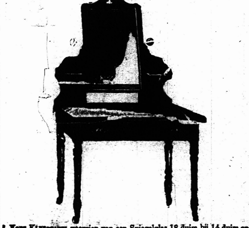
VOET KLEPPEN voornemen van een Spiegelglas 18 duim bij 14 duim op patente wielotjes. £2 7s.

Bovengenoemde is aanmerkelijk beneden in prijs dan de inferieure ingevoerde artikelen en daar wij slechts hout gebruiken dat goed gedroogd is in de Kolonie zullen Koopers het voordeel hebben van onse waarborgd dat de artikelen de hitte van het klimaat zullen staan.