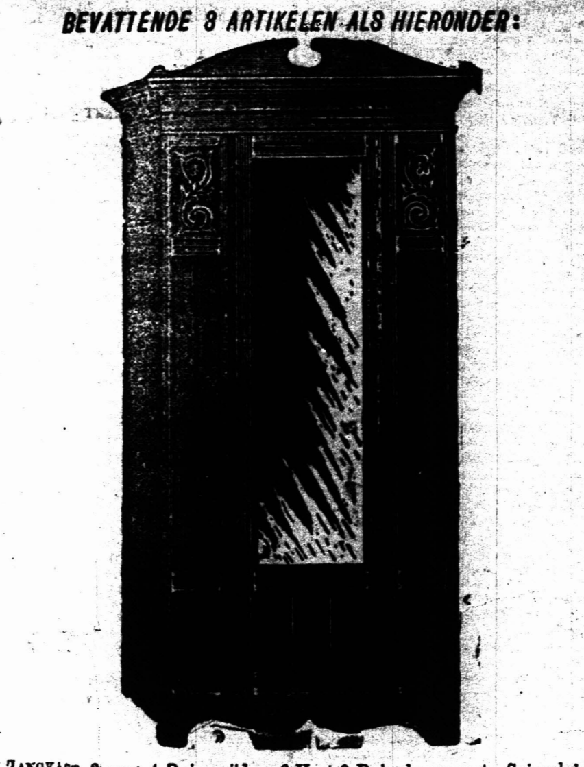
LANGKAST, 8 voet 4 Duim wijd en 6 Voet 9 Duim hoog, met Spiegelglas, 48 Duim bij 14 Duim. £25 5s.

Stellen nu ten toon hun laatste eerbekraal Het 'Jameson' Slaapkamer Set (ONS EIGEN MAAKSEL), IN GOED GEDROOGD SOLIED ESSCHENHOUT, KOMPLEET, £29 16s. £29 16s. BEVATTENDE 3 ARTIKELN ALS HIERONDER: