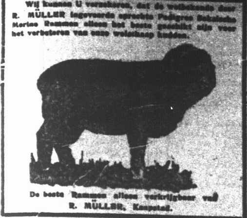
De beste Bismarck afkomst verrijkt met R. MULLER, Kaapstad.