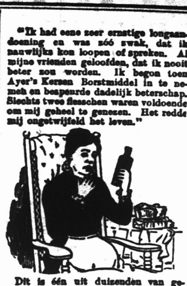
De Ayer's Cherry Pectoral is een uitstekend middel tegen alle soorten van hoest, long- en keelontstekingen van allerlei aard.

Applikaties moeten aan de ondergetekende ingezonden worden niet later dan de 4de Januari 1908.