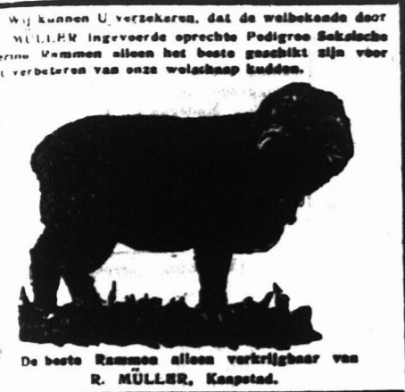
De beste Rammen alleen verkrijgbaar van R. MÜLLER, Kaapstad.

[Dit blad verschijnt drie maal per week: Dinsdags, Dondersdags en Zaterdag.] [Lestakenings prijs per jaar 21 6s., postgelden ingesloten, vooruit betaalbaar.]