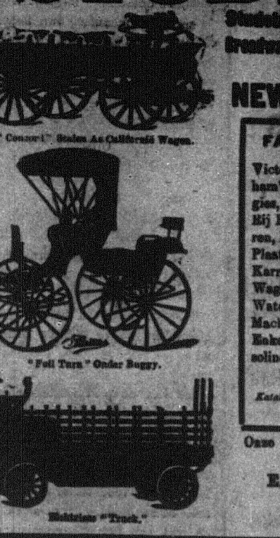
Fabrikanten van Victoria, Landours, Broegham's, Fall Turn Under, Dugies, Fraser's, Barry's, Lichte Bijrijtuigen, Schilbe, Wag Karren, Pony Rijtuigen en Karren, Plaat Wagens en "Damp" Karren. "Damp" Wagens en Wagens voor Konstruktoren, Water Wagens en Street Veeg Machinerie, Lichte en Zware Eeels en Dubbele Tuigen, Gasoline en Elektrische Automobilen, Elektrische Wagens.

STUDEBAKER BROS. CO. VAN N.Y., Credentia en Sewing Machines, at 418 Street, NEW YORK, U.S.A.