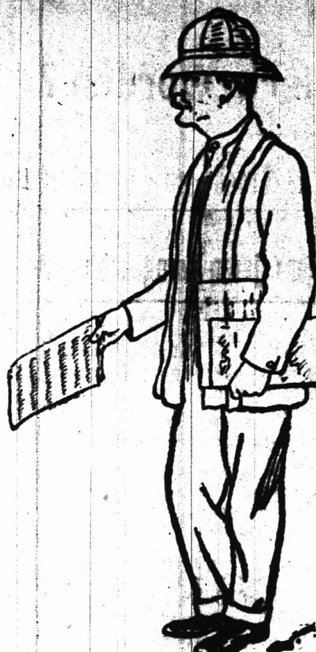
KAAPSTAD, 25 Augustus, 1903.