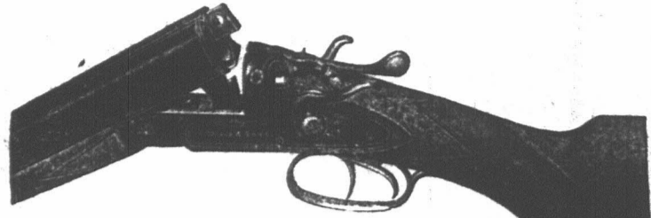
Geweren van alle beschrijvingen, n.l. Hagel- en Kogel-geweren en Combinatie. Prijzen lopende van £5 tot £20.

Kruidentwaren van alle soorten, ook een grote en verschillende voorraad van Fijne Goederen. Huismebelen, IJzerwaren, Bouwers en Wagenmakers Materialen. Omheiningen Materialen een specialiteit. Pianos speciaal voor deze kolonie gemaakt.